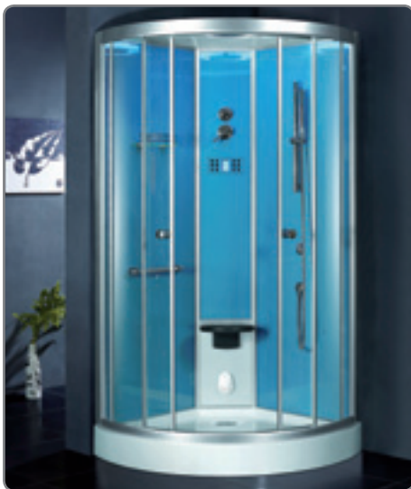
Runddusche, 1000x1000 mm, Höhe 2300 mm, Silber